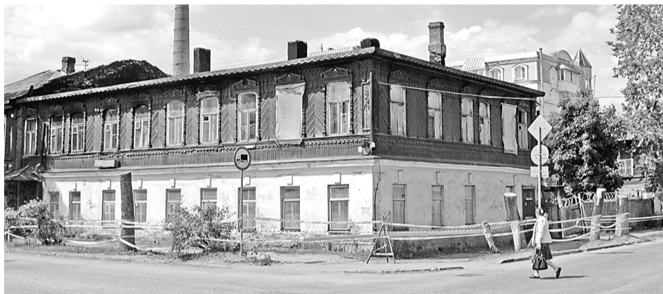
Дом № 25 начинает новую жизнь

Один из кварталов улицы 9 Января всерьёз претендует на право называться самым исторически достоверным уголком города.