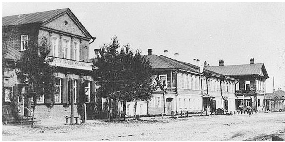
Улица 9 Января (Георгиевская) в начале XX века