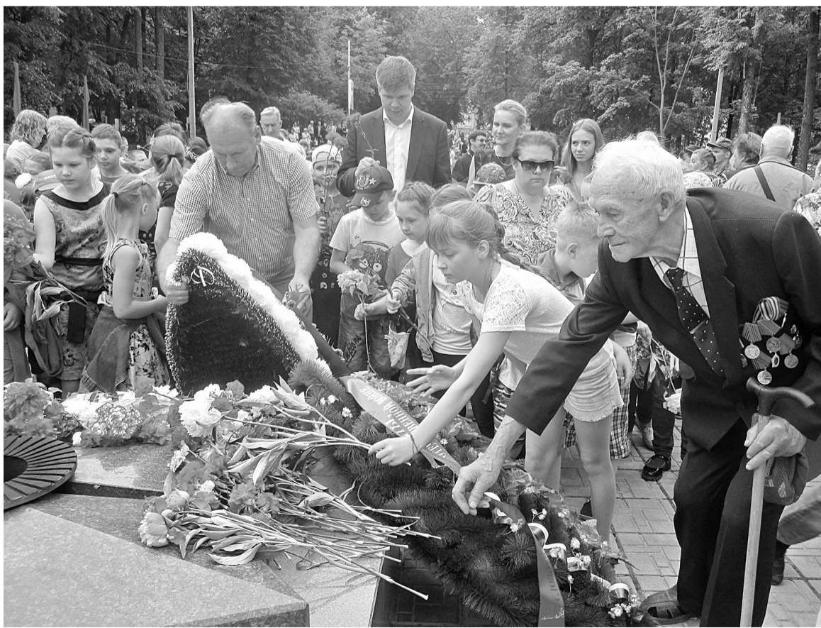
Возложение цветов к Вечному огню